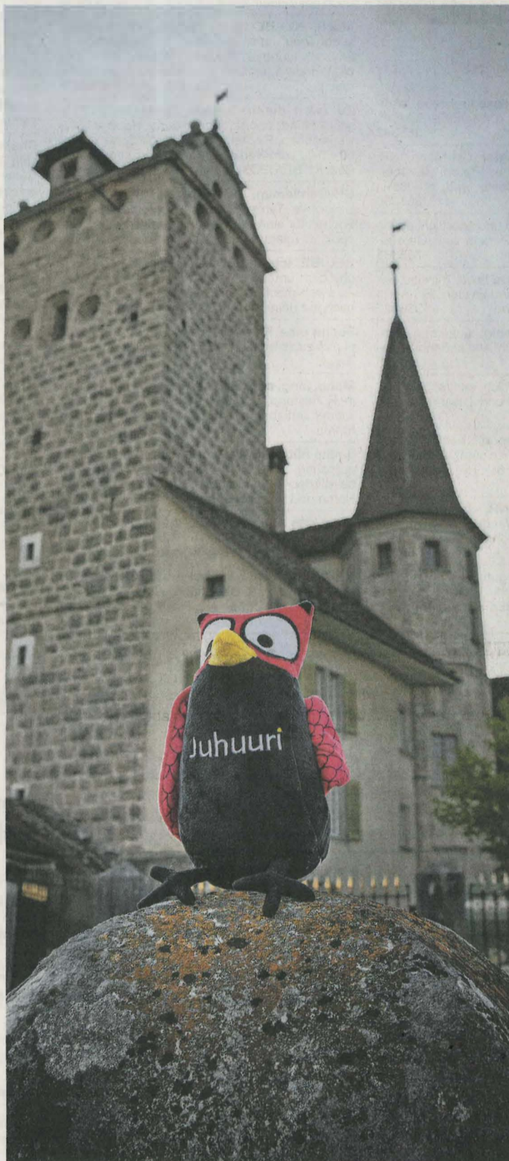
Juhuuri wird Besucherinnen und Besucher im Schloss Aarwangen empfangen.

Im 18. Jahrhundert wurde das Schloss zu einem mächtigen und prächtigen Sitz ausgebaut. Die Landvogtei verblieb bis zum Ende des Alten Berns 1798 in Aarwangen. Nachdem es Einheimische im Zuge der helvetischen Revolution verwüsteten, wurde es an Private verkauft. Bern brachte das Schloss Anfang des 19. Jahrhunderts wieder in seinen Besitz und richtete den Sitz des Oberamtmanns ein. Mit der Gewaltenteilung zog der Regierungsschatthalter aus – das Amtsgericht mit der Wohnung des Gerichtspräsidenten und dem Gefängnis blieben dem Schloss bis 2012 erhalten. Seitdem steht das Wahrzeichen des Dorfs leer. (bey)